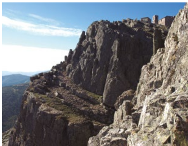
📍 Vista general. 📍 Vista general. Iglesia y crucero. 📍 Uno de los paredones de la Peña y el santuario en la cima.