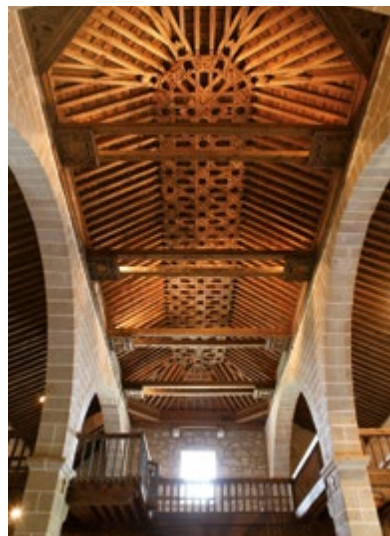
▣ Plaza del Altozano. ▣ Artesonado de la iglesia del Robledo.