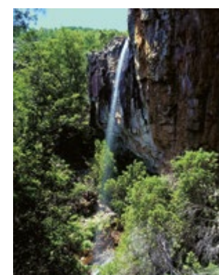
📍 Monasterio de Santo Desierto de San José. 📍 Ruinas de la ermita de San Antonio. 📍 El Chorro.