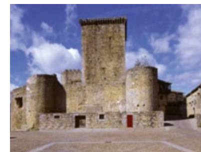
▣ La villa, magnífica atalaya sobre los valles. ▣ Fiesta de las Águedas: indumentaria tradicional. ▣ Castillo y plaza de armas.